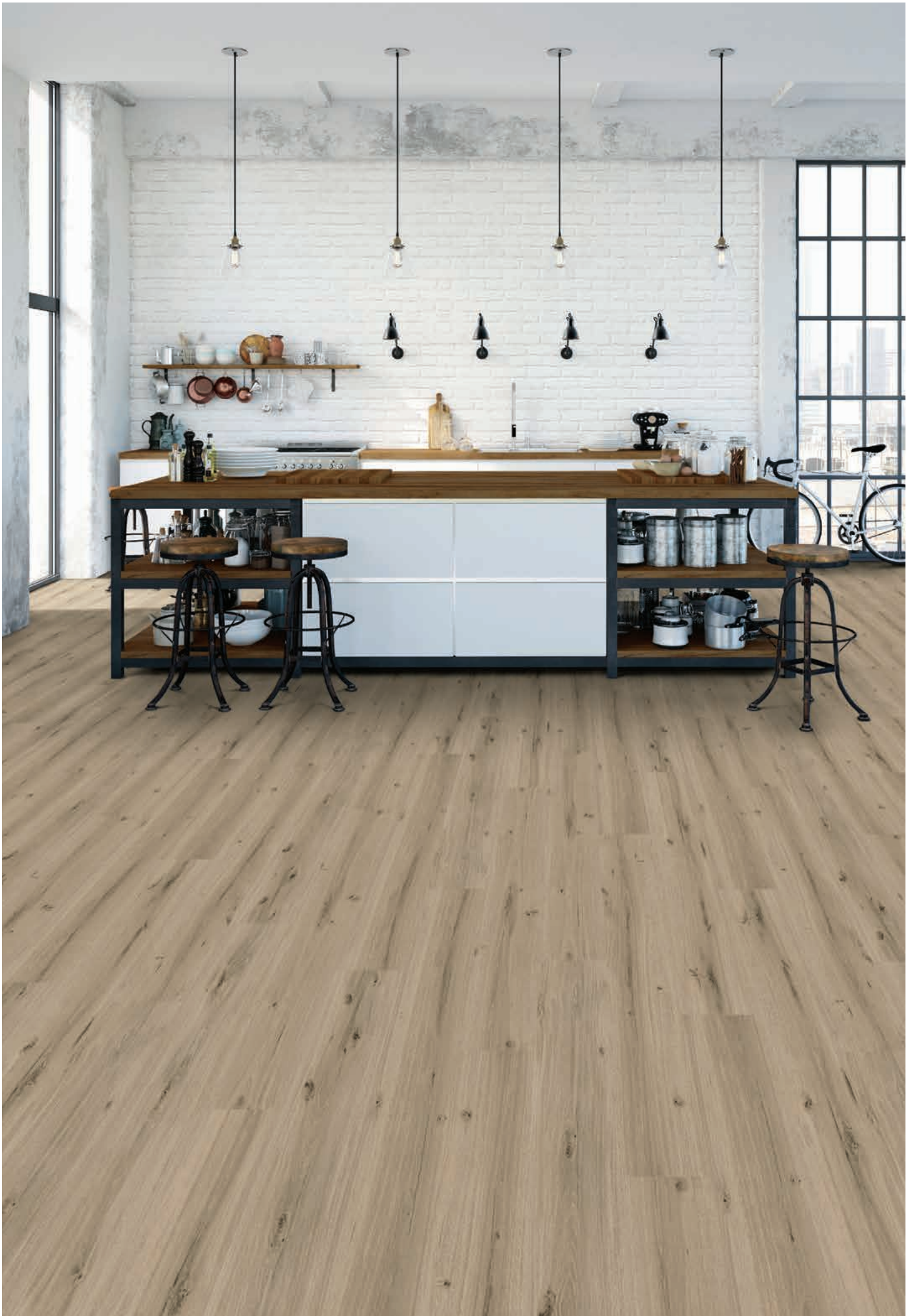
Vinyln | Schwedeneiche mit Synchronprägung