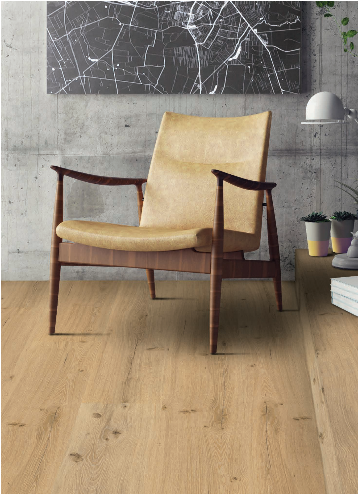
Vinylan | Gold Oak mit Synchronprägung