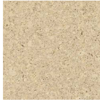
Classico creme geölt