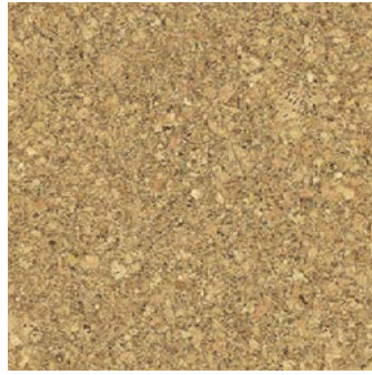
Classico natur geölt