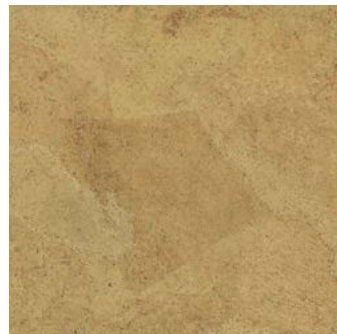
Harmony natur geölt