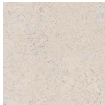
Arriba perlweiß geölt