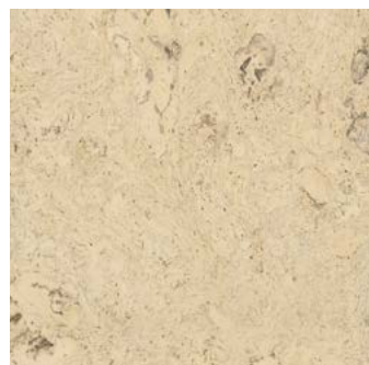
Rumba creme geölt