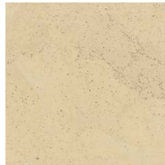
Harmony creme geölt