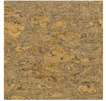
Limbo natur geölt