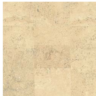
Jazz creme geölt