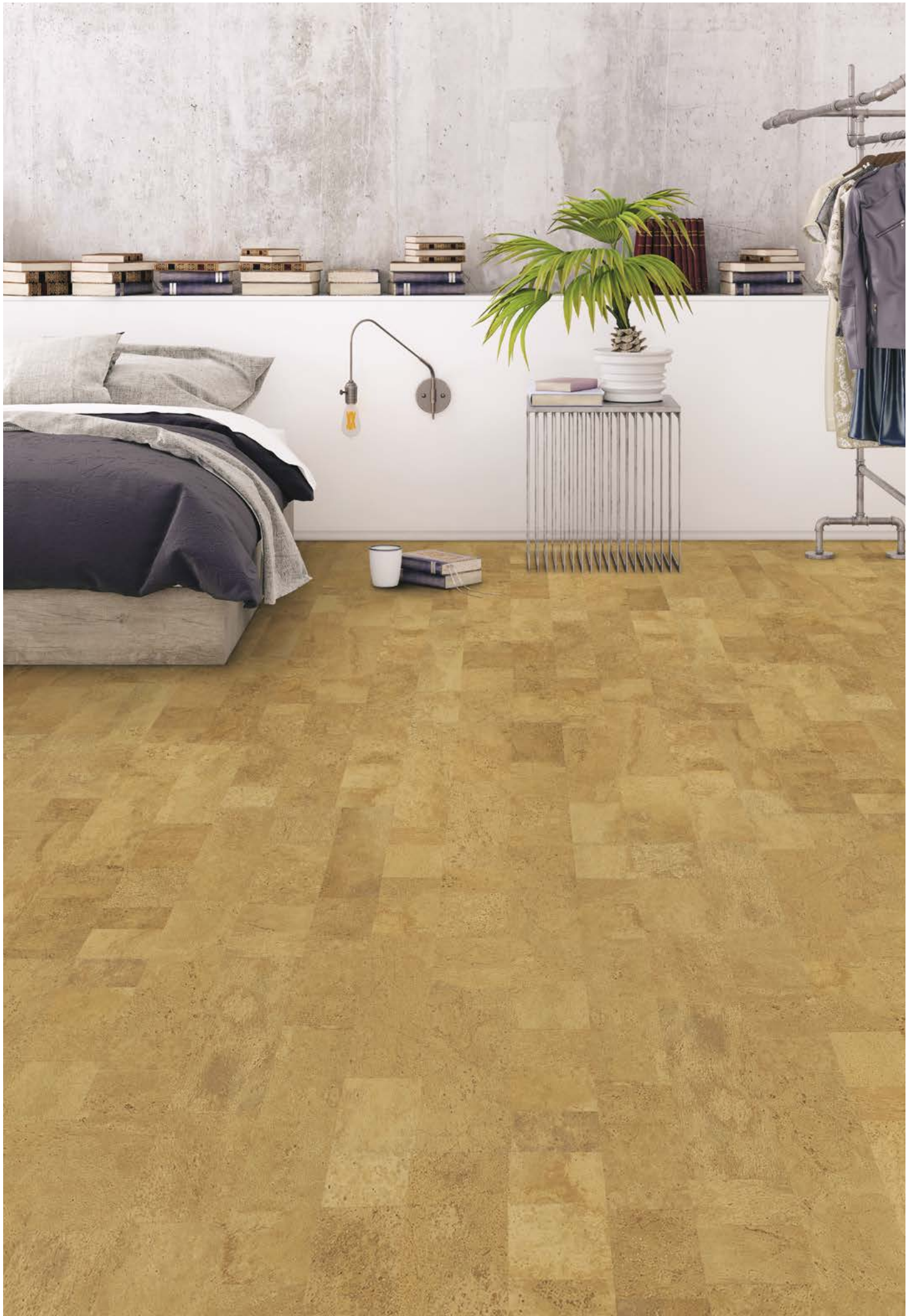
Korkplus | Jazz natur, geölt