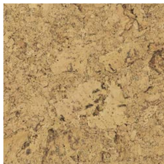
Arriba natur geölt