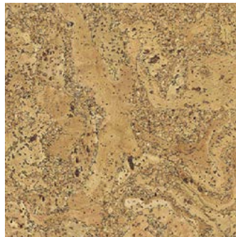
Salsa natur geölt