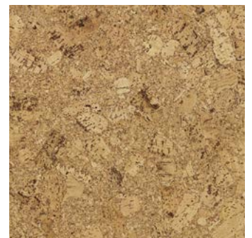
Tango natur geölt