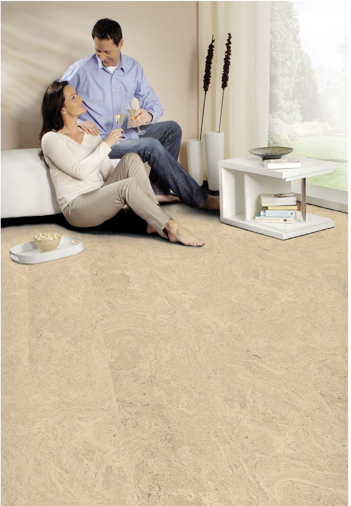
Korkplus | Salsa creme, geölt