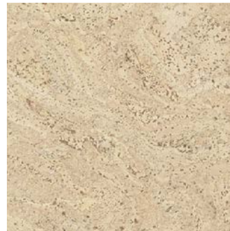
Salsa creme geölt