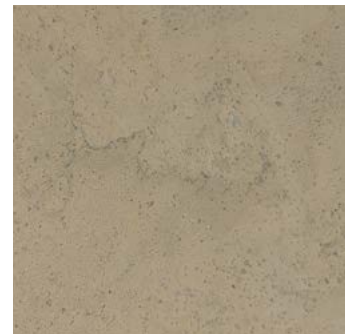
Harmony sand geölt