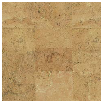
Jazz natur geölt