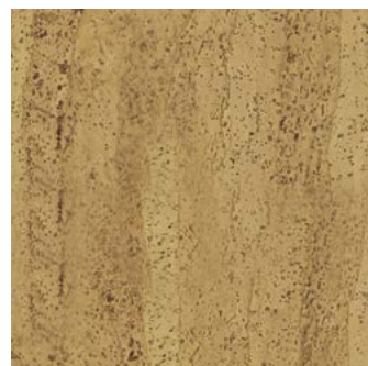
Swing natur geölt