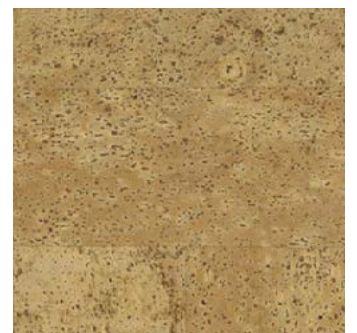
Noblesse natur geölt