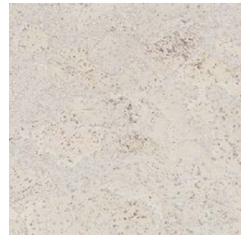
Salso perlweiß geölt