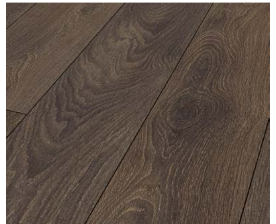
Oak Messina – Synchronprägung