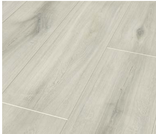
Oak Bologna – Synchronprägung