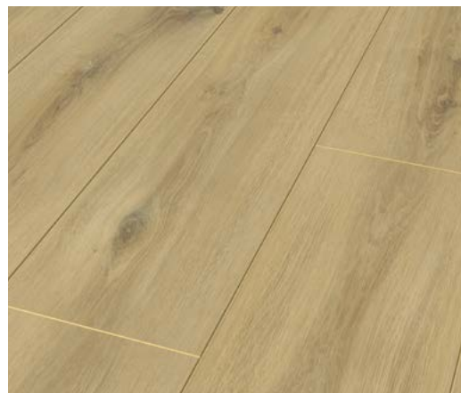
Oak Turin – Synchronprägung