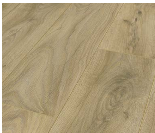
Oak Salerno – Synchronprägung