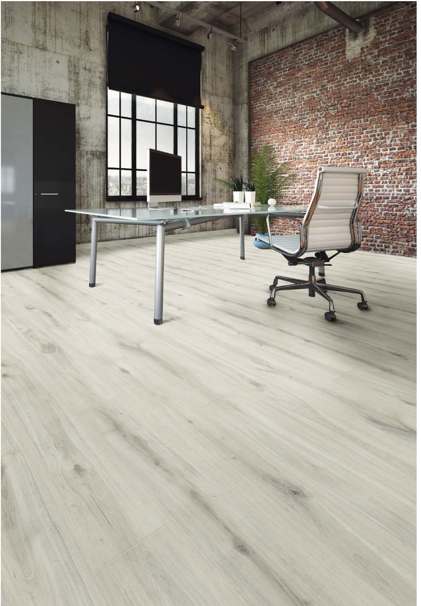
Aqualan | Oak Bologna