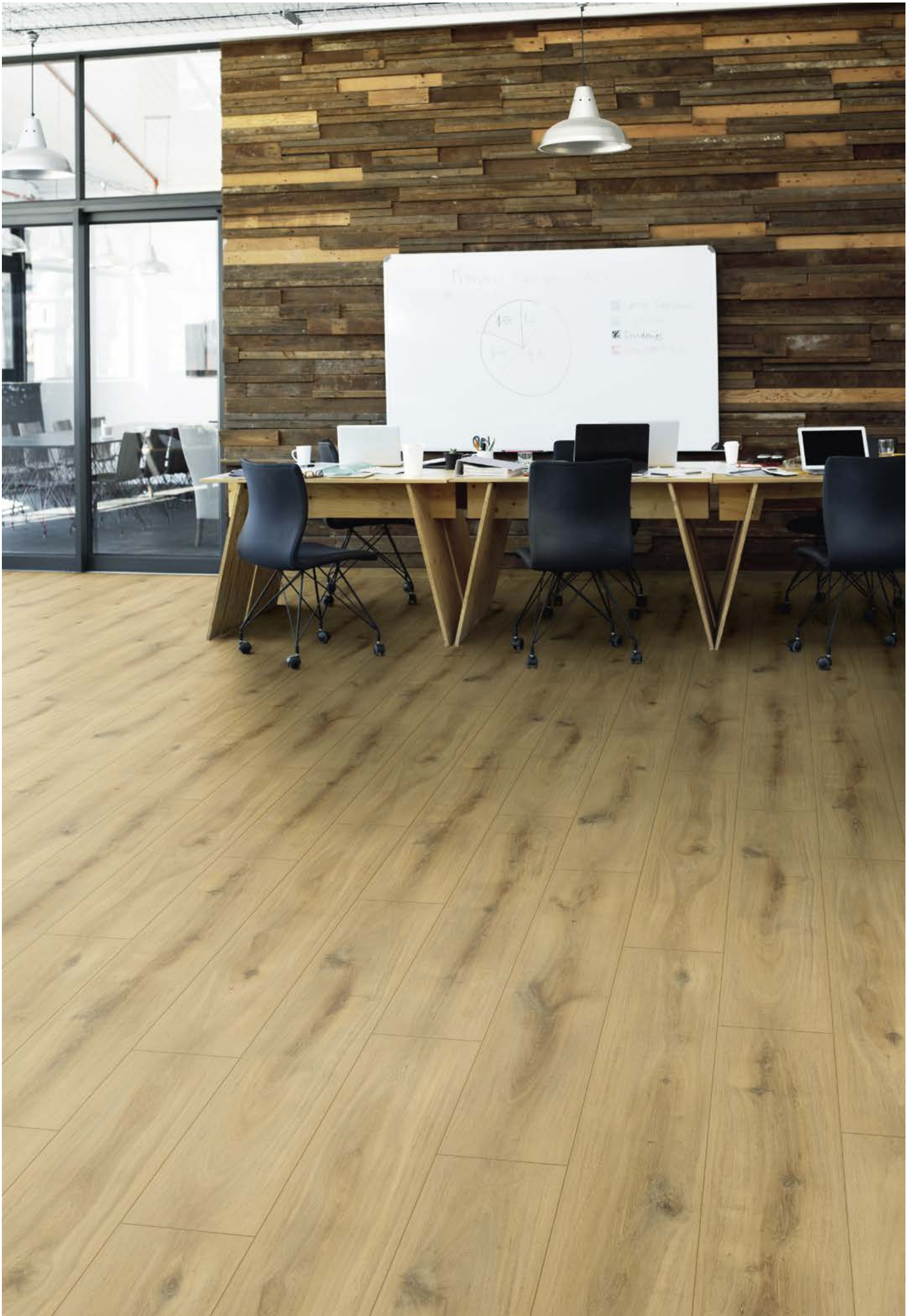
Aqualan | Oak Turin