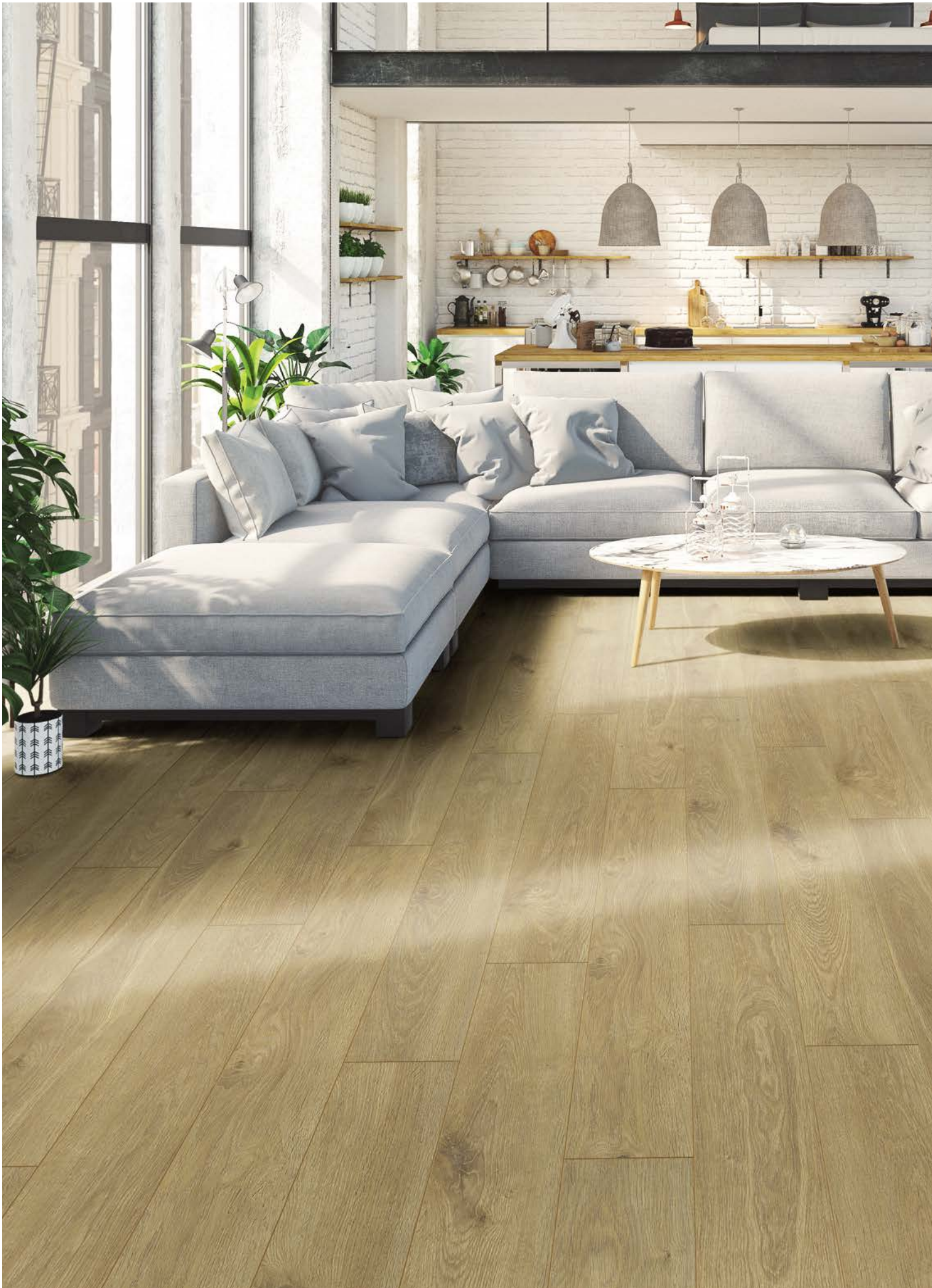
Aqualan | Oak Venedig