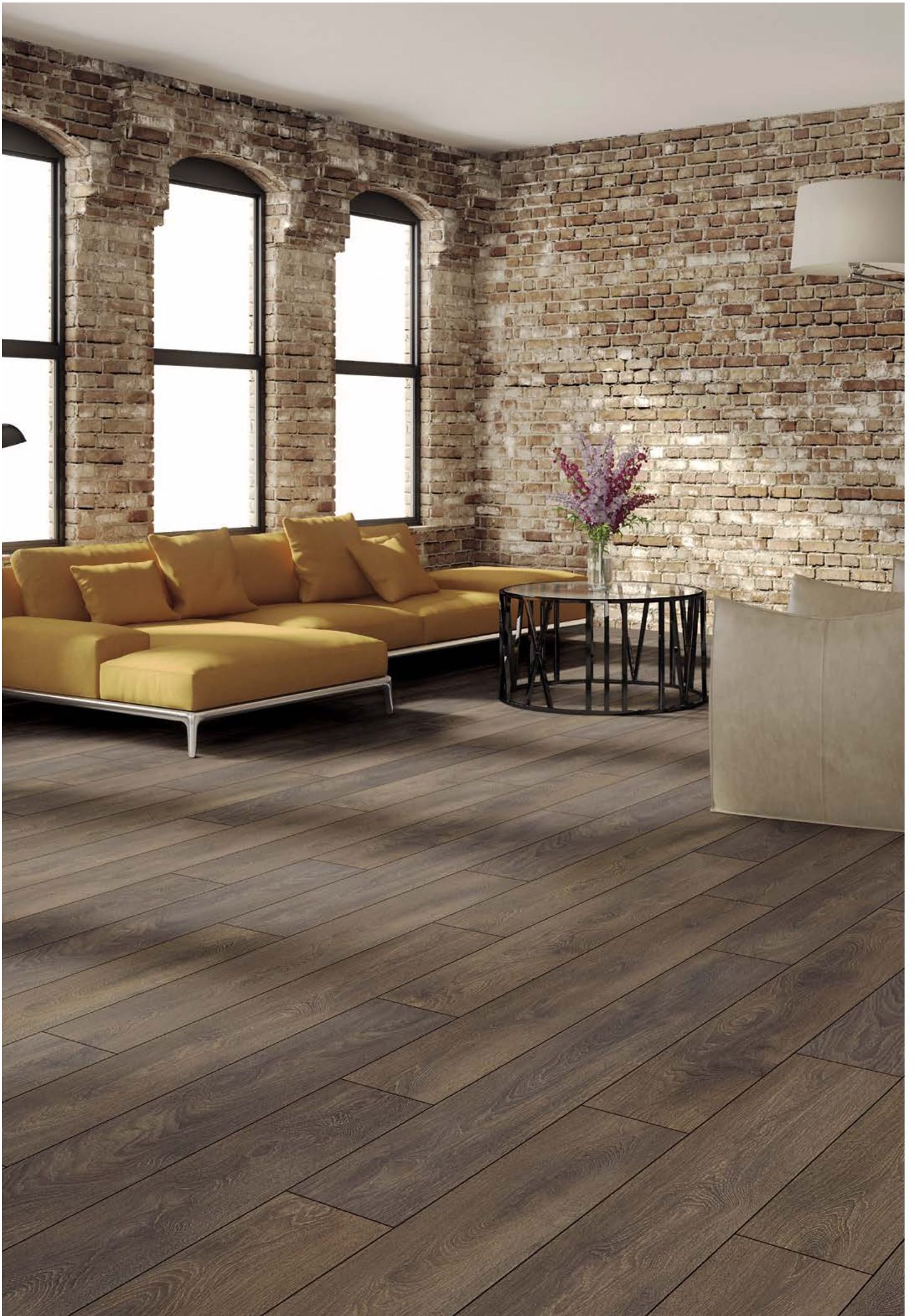
Aqualan | Oak Messina