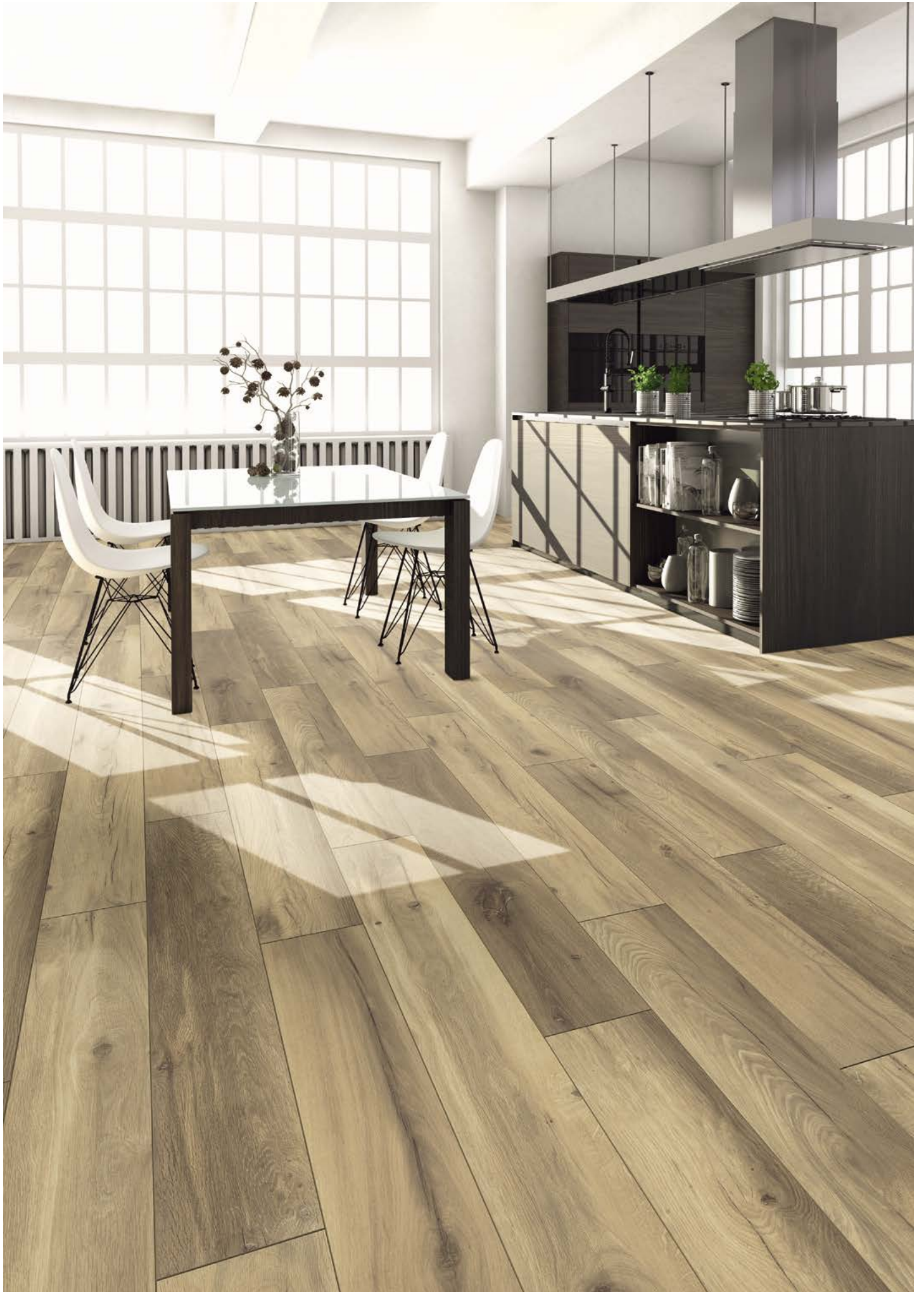
Aqualan | Oak Mailand