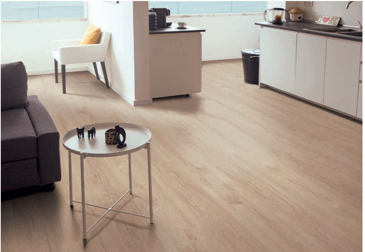
Corelan plus | Eiche Toluca