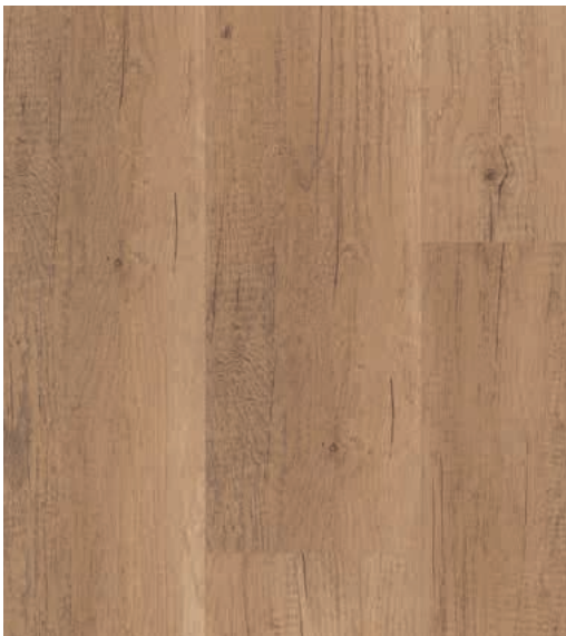
Eiche La Paza