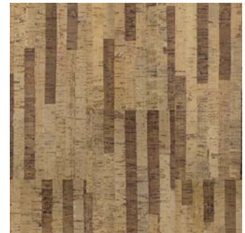
Strada lackiert, furniert