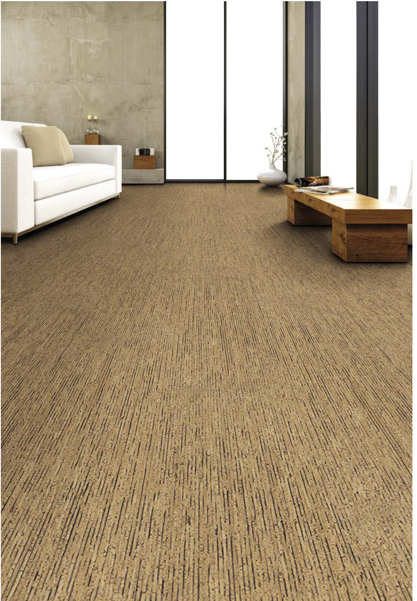
Sombra Kork | Mikado