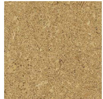
Cortina lackiert, furniert